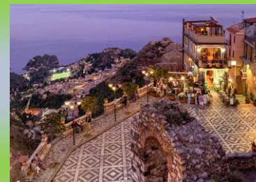
Castelmola centro storico (ME)