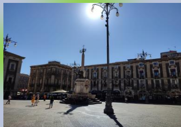
Piazza Duomo Catania