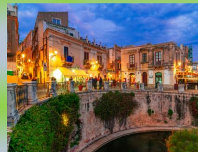
Centro storico Ortigia di Siracusa