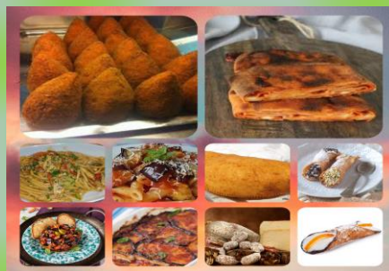
Le diverse specialità della cucina tipica siciliana