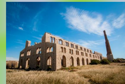
Fornace Penna (RG)