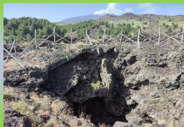
Grotta Santa Barbara

prelibatezze gastronomiche, caratteristiche della cucina tipica siciliana. Durante le belle giornate di mare calmo o nel periodo estivo si potranno ammirare anche i tratti costieri dell'area catanese attraverso escursioni in canoa, associando dunque due o più discipline per coloro che vogliono scoprire il territorio a 360°, quindi non solo bike.