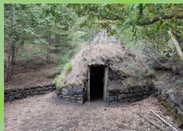
«Pagghiaru» lungo la pista Altomontana